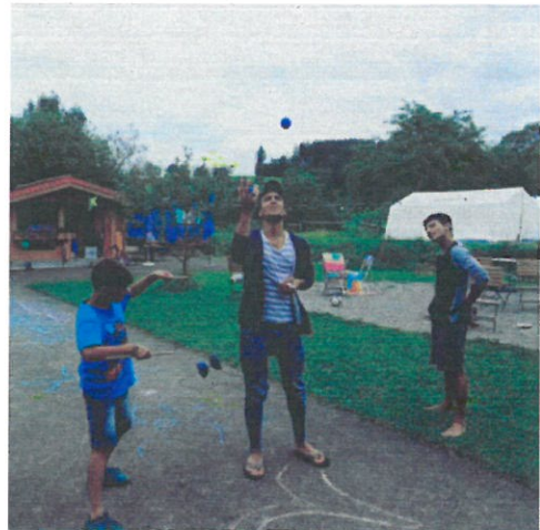
Freizeit, einfach spielen