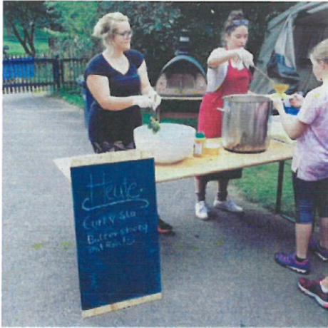
Essensausgabe (meist in Deutsch und Arabisch)