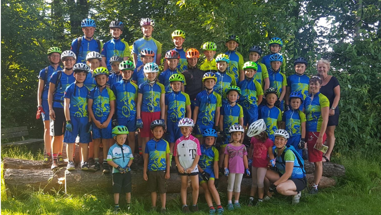
SV St. Georgen Abteilung MTB, Fahrer und Betreuer 2020